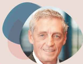
Philippe SAUREL Maire de la Ville de Montpellier Président de Montpellier Méditerranée Métropole

Afin de préserver l'intégralité des engagements artistiques de programmation, les temps de répétitions ou de créations auprès des compagnies partenaires mais aussi du travail accompli auprès des associations et établissements scolaires du quartier, j'ai souhaité pouvoir maintenir le Théâtre La Vista dans ses locaux actuels pour l'intégralité de la saison 17-18. Le théâtre développera son futur projet lors de sa prochaine saison dans ses nouveaux locaux à la Cité Gély.